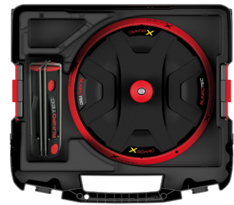
Symbolfoto - ohne Inhalt